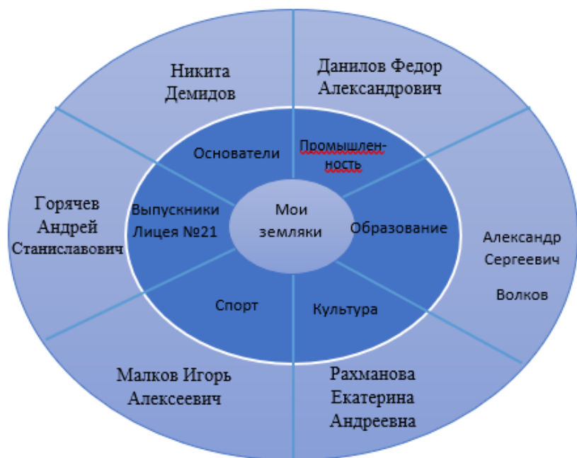
Рабочий лист по личности